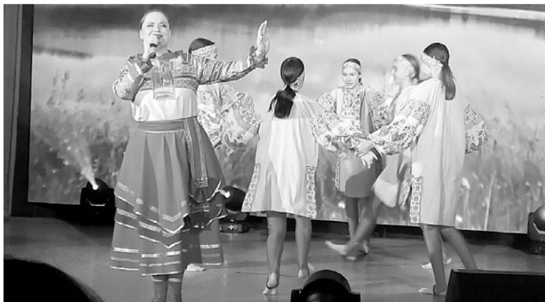
На благотворительном концерте