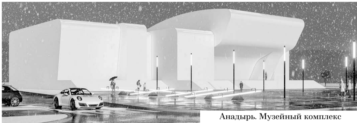
Анадырь. Музейный комплекс

Реализация плана комплексного развития будет способствовать запуску новых крупных инвестиционных проектов. В совокупности они позволят создать не менее 3 773 рабочих мест, в 1,7 раза поднять валовой городской продукт, в 1,3 раза по-