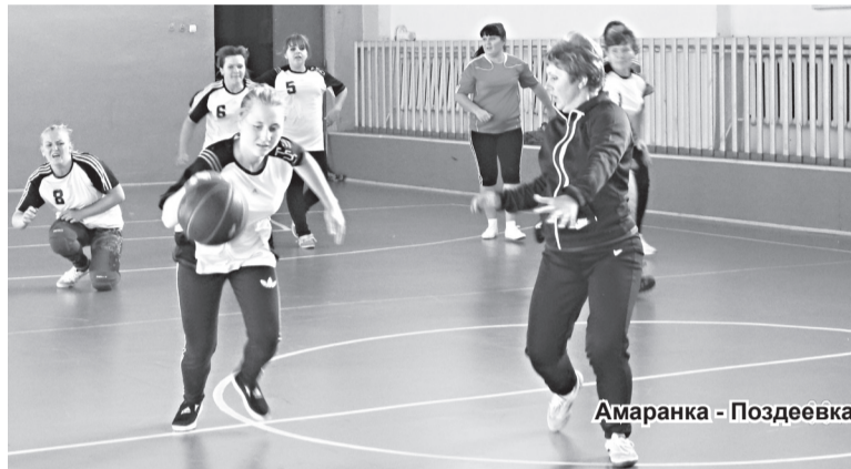
Амаранка - Поздеевка