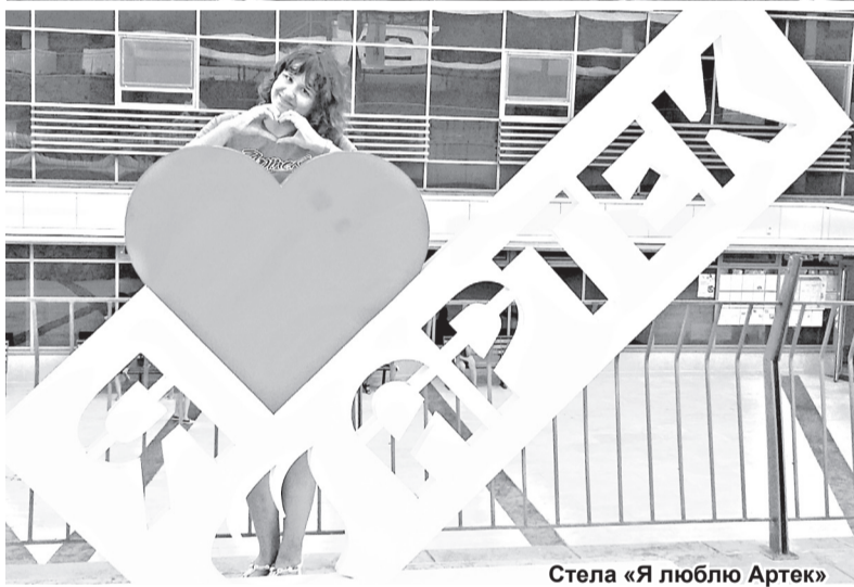
Стела «Я люблю Артек»