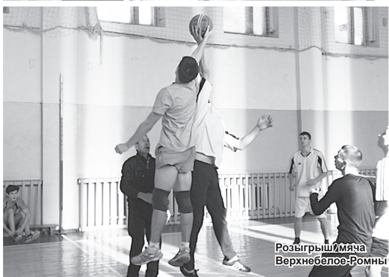
Розыгрыш мяча Верхнебелое-Ромны