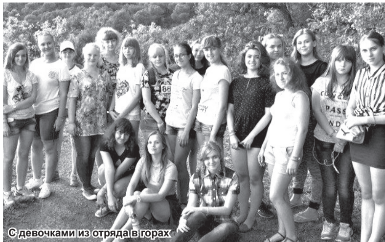
С девочками из отряда в горах