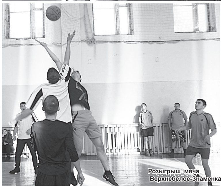
Розыгрыш мяча Верхнебелое-Знаменка