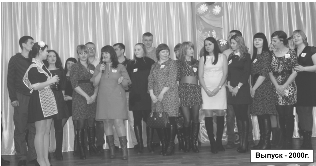
Выпуск - 2000г.