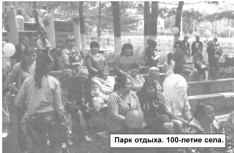
Парк отдыха. 100-летие села.