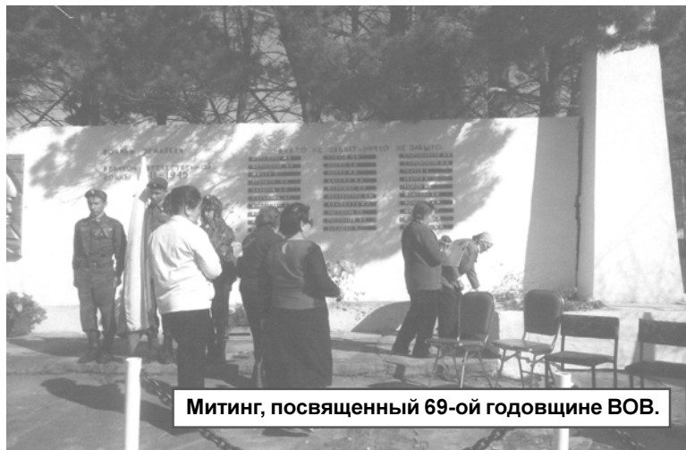
Митинг, посвященный 69-ой годовщине ВОВ.