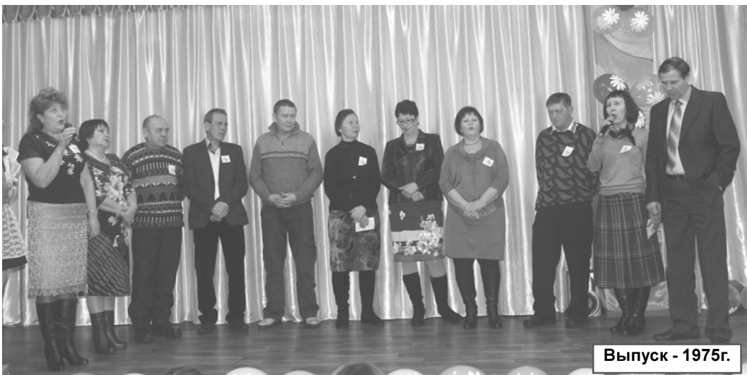
Выпуск - 1975г.