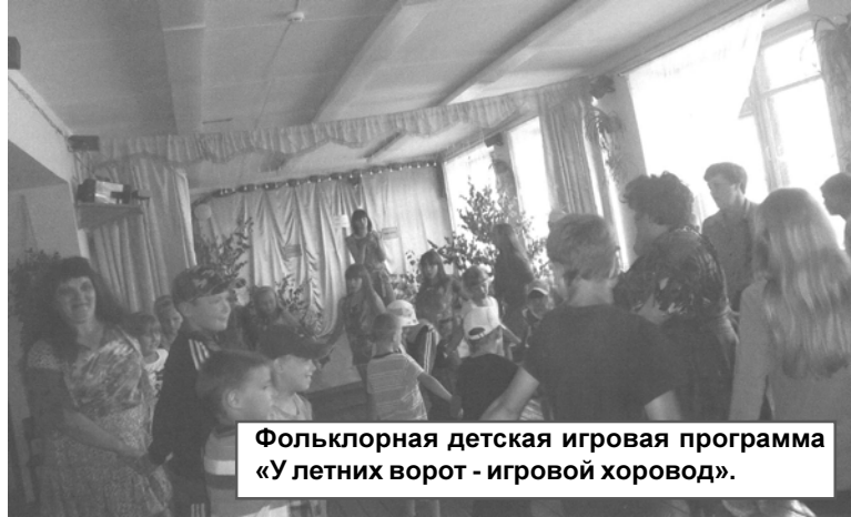
Фольклорная детская игровая программа «У летних ворот - игровой хоровод».