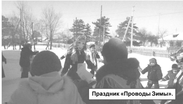
Праздник «Проводы Зимы».