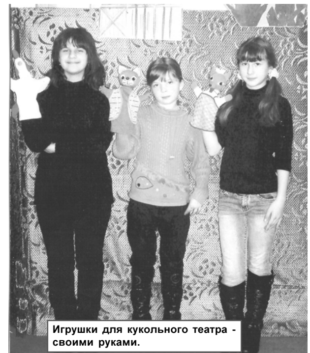
Игрушки для кукольного театра - своими руками.