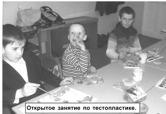
Открытое занятие по тестопластике.