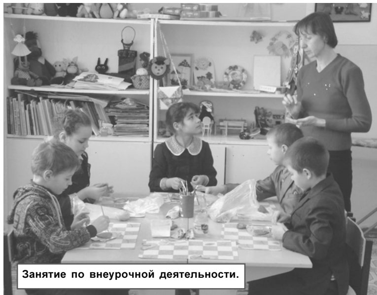
Занятие по внеурочной деятельности.