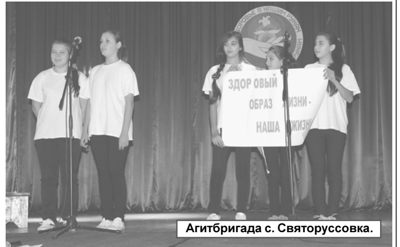
Агитбригада с. Святоруссовка.

показали девчонки из школы, находящейся в районном центре. Юные модели из театра мод «Яркие краски» проде-