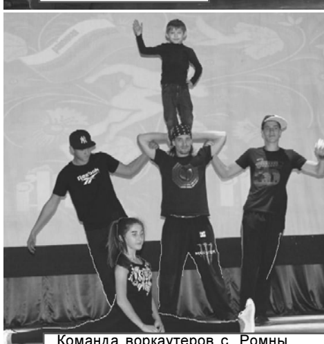
Команда воркаутеров с. Ромны