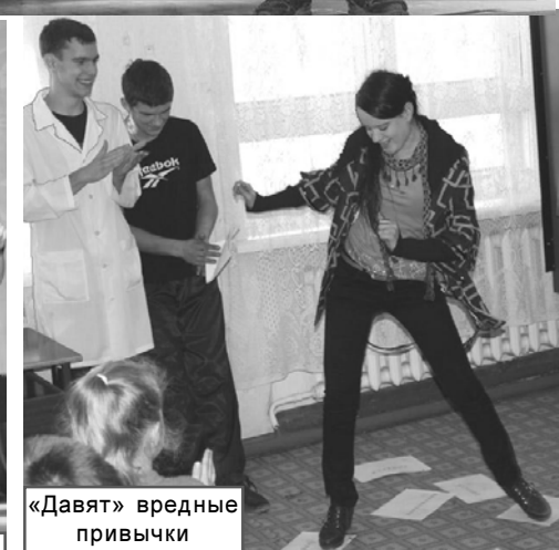
«Давят» вредные привычки