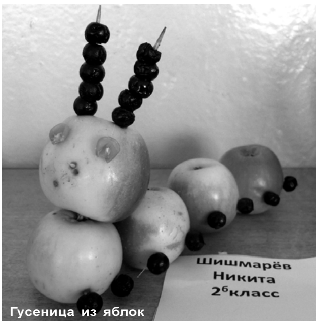
Гусеница из яблок