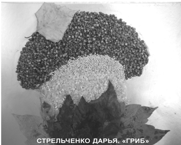
СТРЕЛЬЧЕНКО ДАРЬЯ. «ГРИБ»