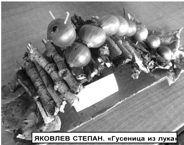
ЯКОВЛЕВ СТЕПАН. «Гусеница из лука»