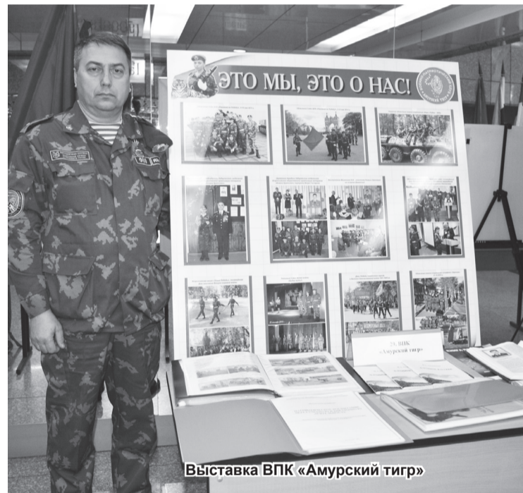
Выставка ВПК «Амурский тигр»

ной палаты Амурской области, органов государственной и муниципальной власти Амурской области, образовательных учреждений, общественных организаций и движений, некоммерческих организаций и военно-патриотических клубов Амурской области в реализации Плана мероприятий по патриотическому воспитанию граждан Амурской области.