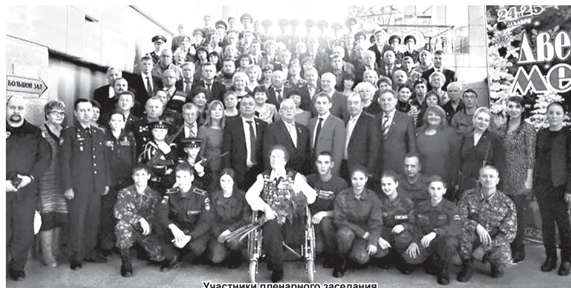
Участники пленарного заседания