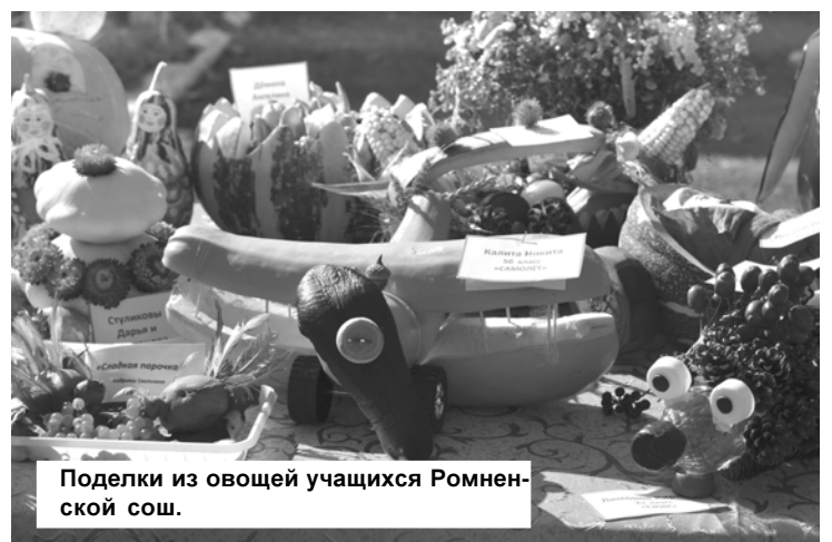
Поделки из овощей учащихся Ромненской сош.