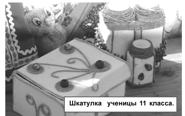
Шкатулка ученицы 11 класса.