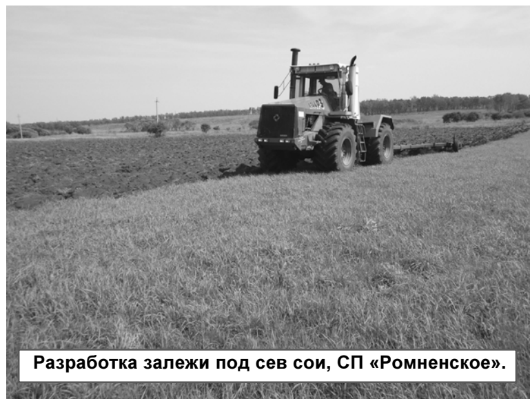
Разработка залежи под сев сои, СП «Ромненское».

где были подведены итоги сева и рассмотрены вопросы по заготовкам кормов, в частности о готовности к ним хозяйствами Константиновского и Ромненского районов, подготовке техники к уборке урожая 2014 года. Коллегия отметила недостатки в деятельности этих территорий,