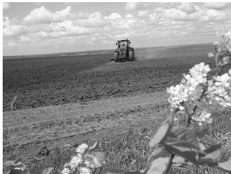
На соевых полях, КФХ «Владимир».

20 июня в Минсельхозе Амурской области прошла коллегия,