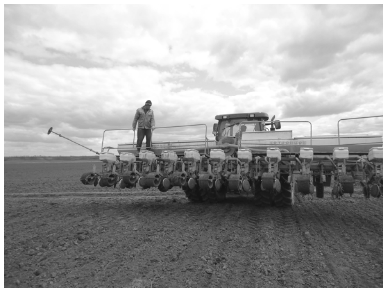
Сев кукурузы, ООО «Красная Звезда».