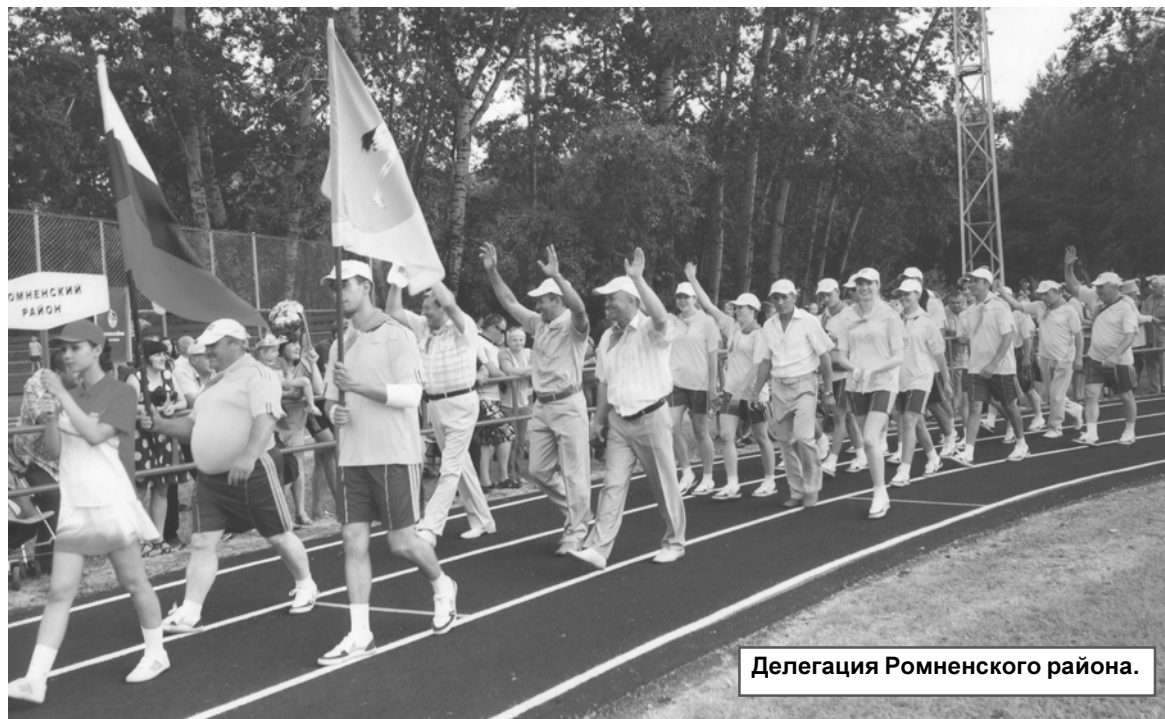
Делегация Ромненского района.

С 27 по 29 июня 2014 г. спортсмены Ромненского района приняли участие в финальных соревнованиях XXIX областной сельской комплексной Спартакиады.