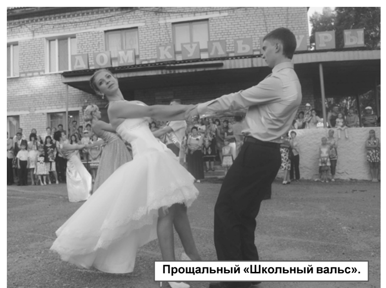
Прощальный «Школьный вальс».