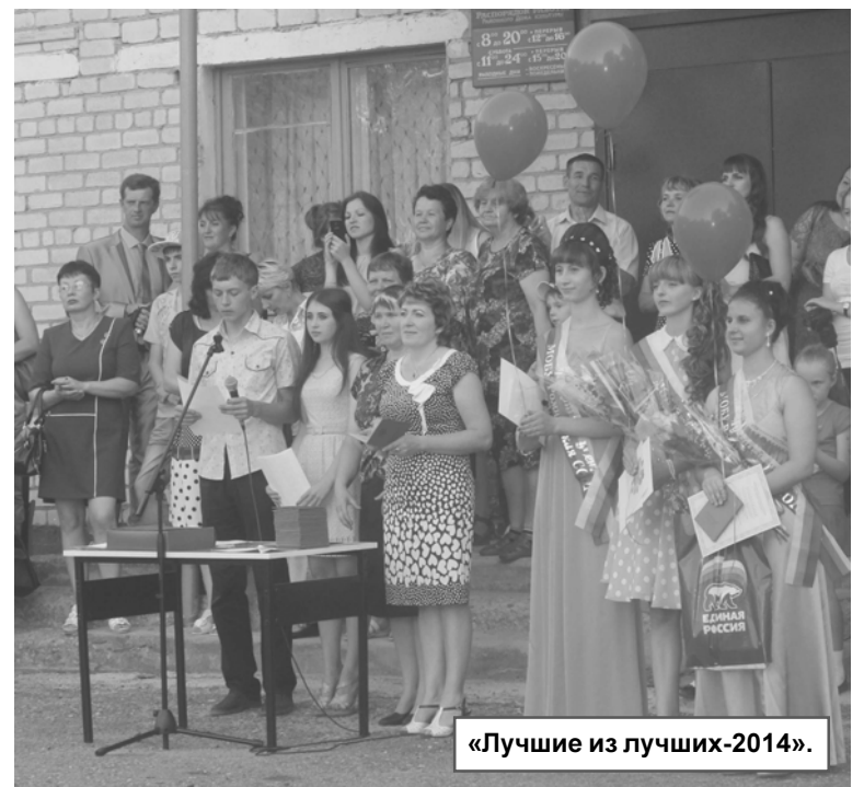
«Лучшие из лучших-2014».