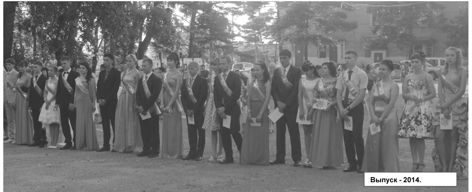
Выпуск - 2014.

Не остались в долгу юноши и девушки, они подарили прекрасный танец. Старинный, но такой родной каждому сердцу школьный вальс. Зрители смотрели на кружащиеся пары и вспоминали свои выпускные вечера. Юноши и девушки, словно принцы и принцессы из волшебной сказки дарили окружающим минуты