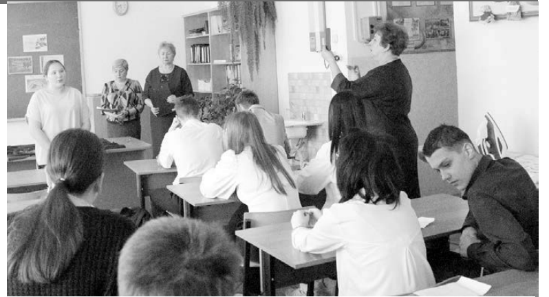
В Ромненской школе

В конце мероприятия работники музея провели акцию «Блокадный хлеб Ленинграда», где каждый участник получил паёк - 125 граммов хлеба. Конечно, этот