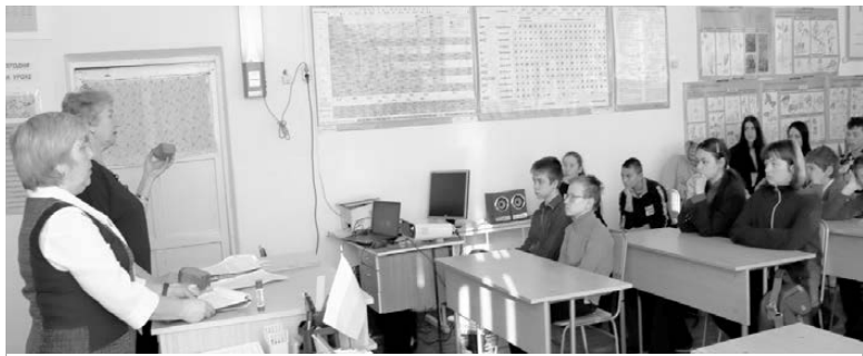
В Знаменской школе

хлеб значительно отличается от блокадного, в который добавляли целлюлозу, шрот.