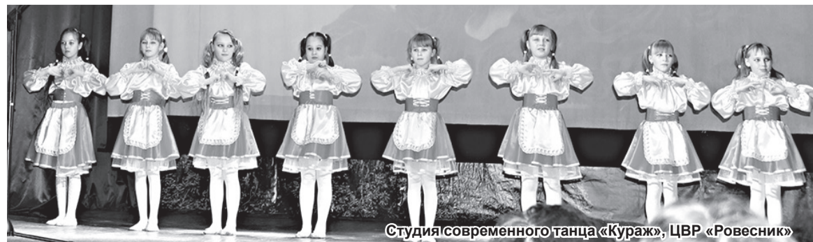
Студия современного танца «Кураж», ЦВР «Ровесник»