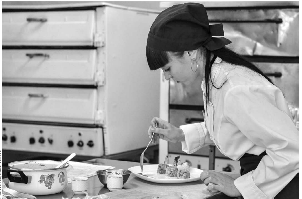
Минск Амурской области

— Целевое обучение студентов — одна из наиболее эффективных практик по привлечению на предприятия молодых