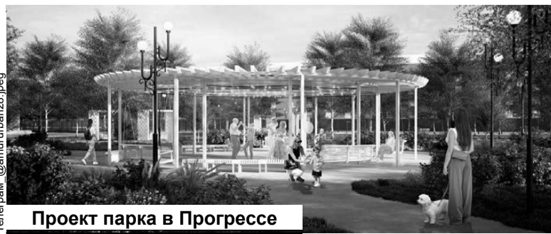
Проект парка в Прогрессе

среды для муниципальных образований ДФО победили ещё четыре амурских проекта. На обновление зон отдыха в Завитинске, Прогрессе, Сквородине и Свободном направят более 420 миллионов рублей. Еще три проекта — в Тынде, Зее и Циолковском — регион планирует подать на следующий этап конкурса. Сейчас Центр развития территорий вместе с муниципалитетами разрабатывает дизайн будущих зон отдыха и сметы для благоустройства, сообщает