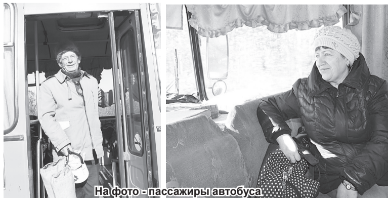
На фото - пассажиры автобуса

В минувший вторник в читальном зале межпоселенческой центральной библиотеки Ромненского района в рамках районной целевой профилактической операции «Здоровье» прошел час размышления в играх «Сохрани себя для жизни» о ЗОЖ.