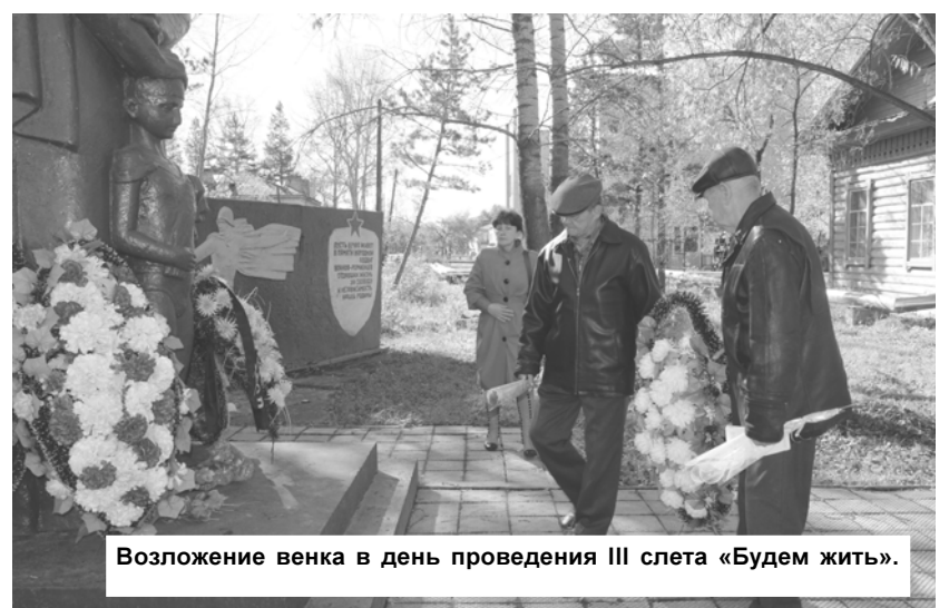
Возложение венка в день проведения III слета «Будем жить».