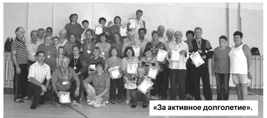
«За активное долголетие».