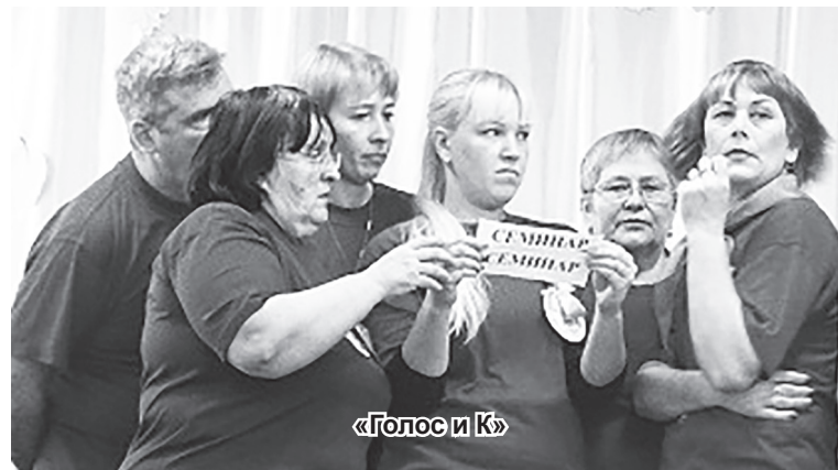
«Голос и К»