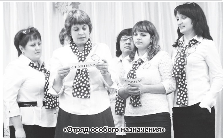
«Отряд особого назначения»

Репортаж подготовила Позднякова В.Д., учитель начальных классов МОБУ Ромненская СОШ