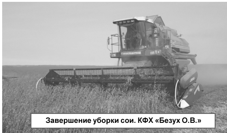
Завершение уборки сои. КФХ «Безух О.В.»

В Ромненском районе началась уборка основной культуры - сои. Повсеместно все хозяйства приступили к обмолоту. Всего же предстоит убрать 28000 га. На сегодня наибольшие площади убраны в южных хозяйствах района - КФХ «Безух Р.В.» и «Безух О.В.», на момент выпуска газеты данные хозяйства завершили уборку, ООО «Космос», КФХ «Владимир» и др. Высшая урожайность достигнута в КХФ «Хряков С.А.» (с. Климовка) - 16 центнеров с 1 га. В целом же по Ромненскому району она в пределах 8 центнеров с 1 га.