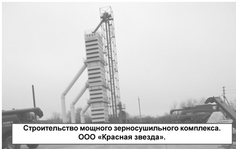
Строительство мощного зерносушильного комплекса. ООО «Красная звезда».