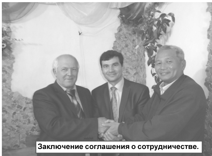
Заключение соглашения о сотрудничестве.

Состоялся очередной рабочий визит в Ромненский район делегации из провинции острова Хоккайдо. В неё вошли представители от президента ОА «Хоккайдо Банк» до фермеров. Гости из страны восходящего солнца познакомились с опытом работы первого совместного предприятия КФХ «Владимир» и Ассоциация «Хоккайдо-фермер» по выращиванию гречихи и сои.