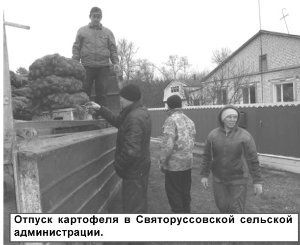
Отпуск картофеля в Святооруссовской сельской администрации.

Наибольшее количество отгруженных огородных даров приходится на Ромненский сельсовет. Выдача производится. Тех, кто не получил положенную долю, и не только пострадавших, просят поспешить.