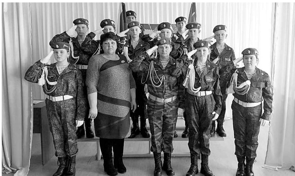
ВПК – наша гордость!