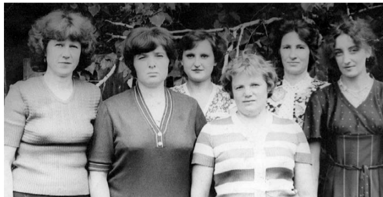
Коллектив типографии. Ромны. XX век