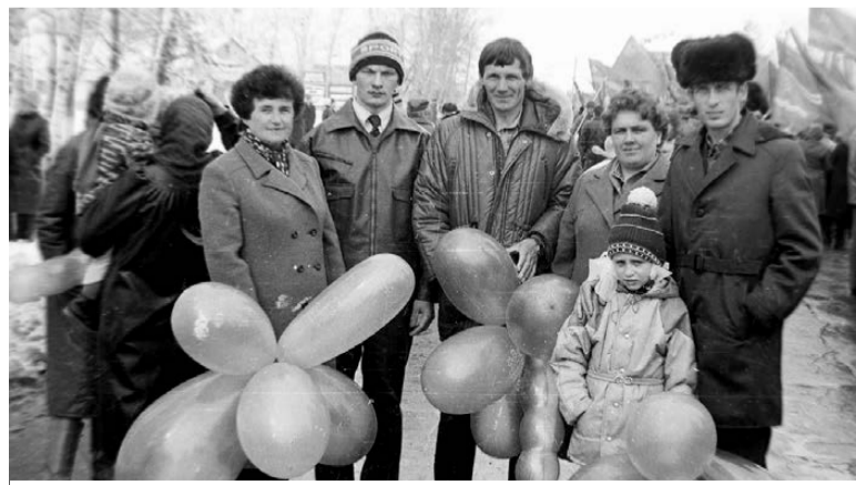
Сотрудники редакции и типографии. Ромны. XX век