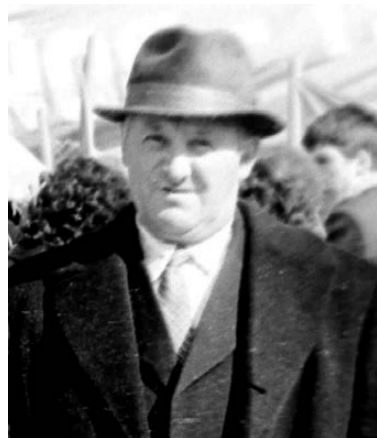
Виктор Геращенко - фотокорреспондент