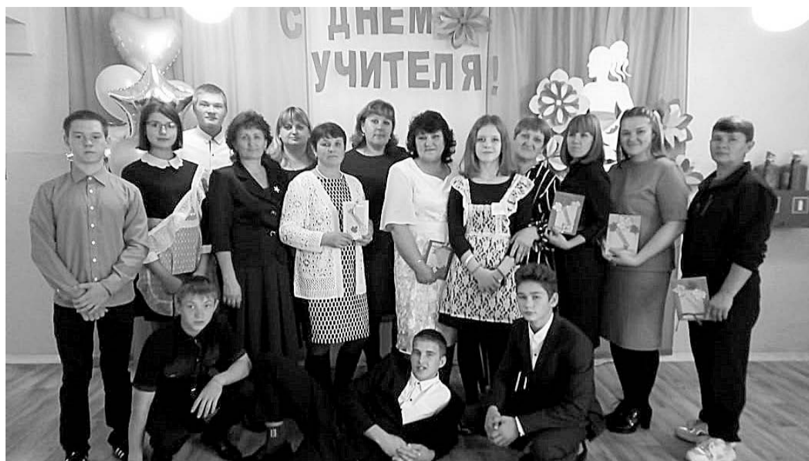
День самоуправления в Амаранской школе - два поколения педагогов

Отдел образования администрации Ромненского округа