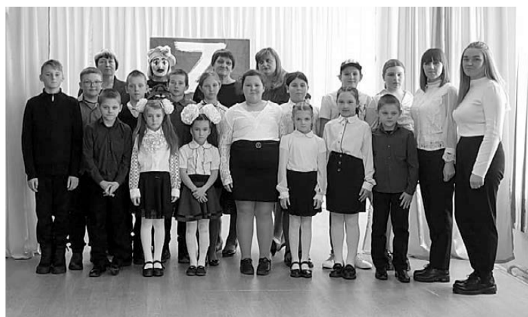
Участники благотворительного концерта