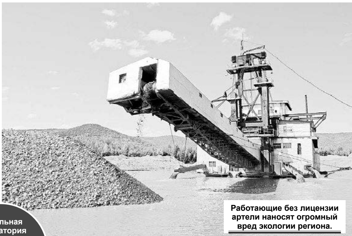
Работающие без лицензии артели наносят огромный вред экологии региона.

- Работа начнется очень скоро, где-то с 15 мая, с самого начала промывочного сезона. Мы сможем мониторить с частотой от еженедельной до ежедневной. Площадь Амурской области - 365 тысяч квадратных километров, территория огромная. Мы исключим южные районы, где не добывается золото, возьмем для мониторинга основные точки - примерно знаем, где находятся кусты незаконной золотодобычи, и охватим около 30 тысяч квадратных километров. Все изменения,