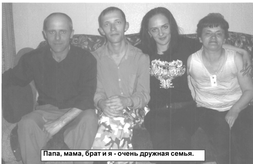
Папа, мама, брат и я - очень дружная семья.