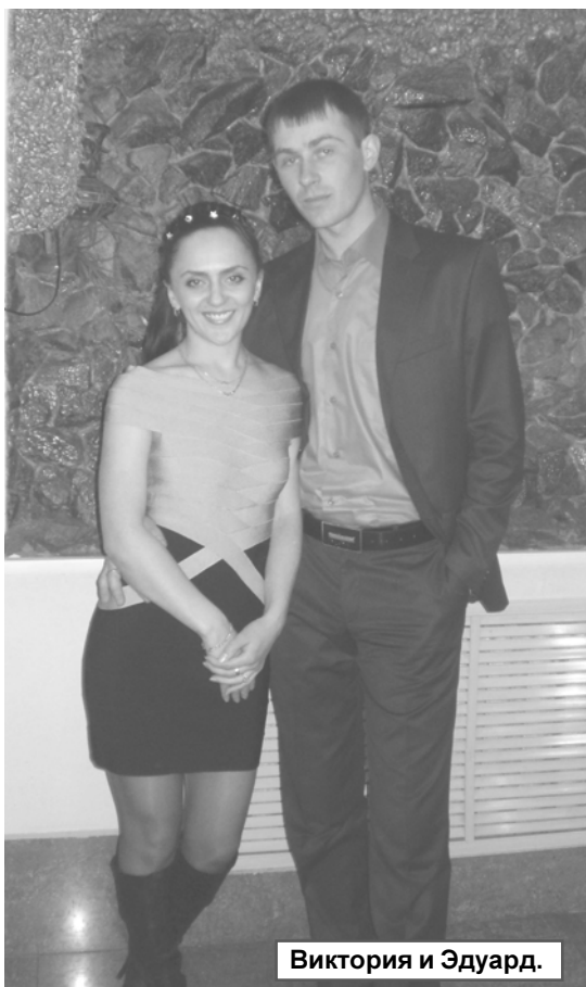
Виктория и Эдуард.