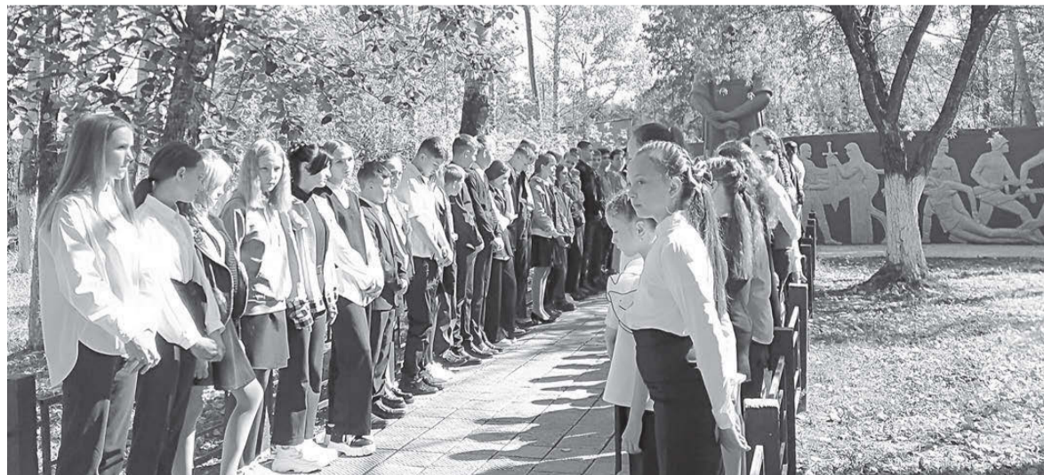
На церемонии возложения венков к мемориальному комплексу героям гражданской и Великой Отечественной войны в честь 77-й годовщины со Дня победы над милитаристской Японией и окончания Второй мировой войны. Ромны