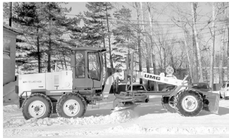
Снегоуборочная техника МКУ «Ромненская администрация» - на улице Гагарина в с. Ромны. 24.11.2021

Жюри подведет итоги конкурса не позднее 20 декабря — победители получают награды. Все работы будут демонстрироваться в выставочном зале музея в период Новогодних праздников. По окончании выставки работы вернутся к своим владельцам.