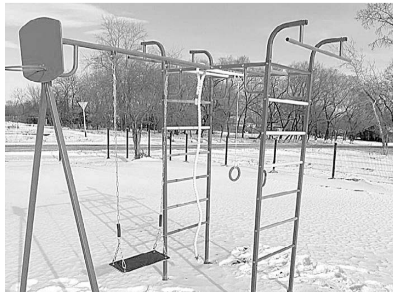
Стадион в с. Дальневосточном построен в рамках программы инициативного бюджетирования