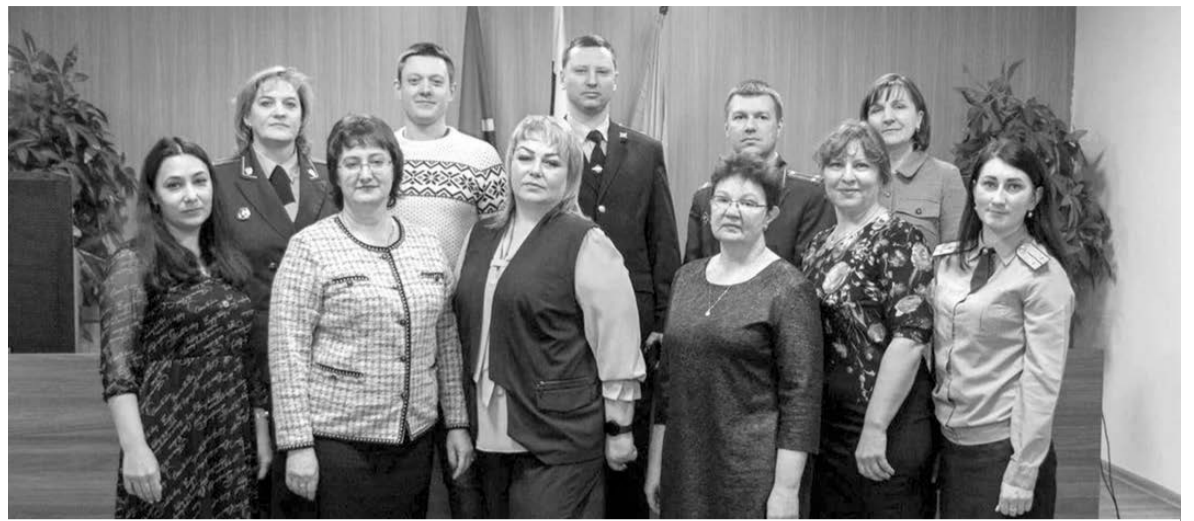
КДН и ЗП.