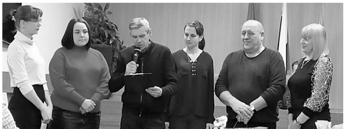
Поздравление от начальников МКУ