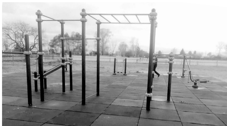
Спортивная площадка в с. Чергали - реализованный проект в рамках программы инициативного бюджетирования