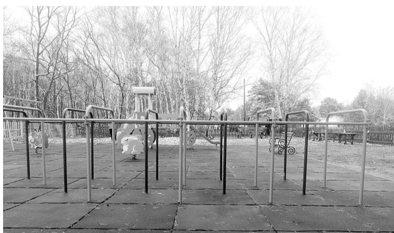
Детская площадка в с. Смоляное - реализация инициативного проекта