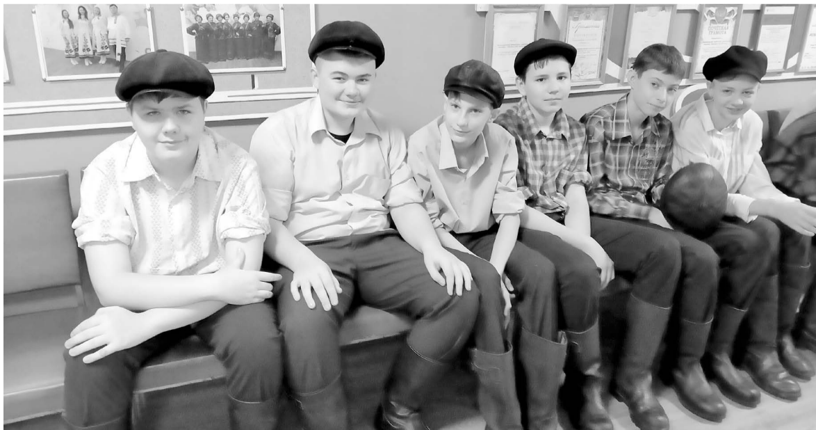
Перед выступлением на театрализованном концерте «Ромненская моя сторона»