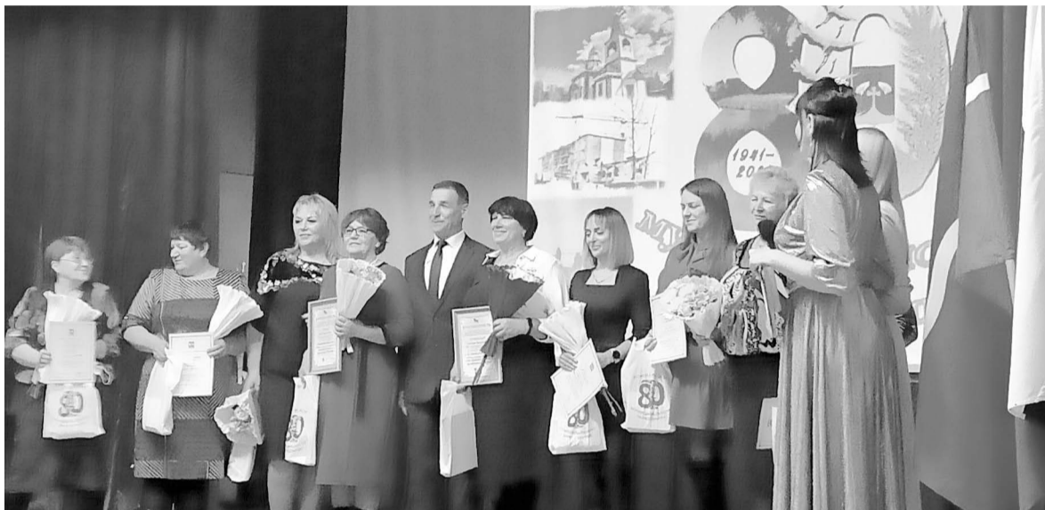
На церемонии награждения