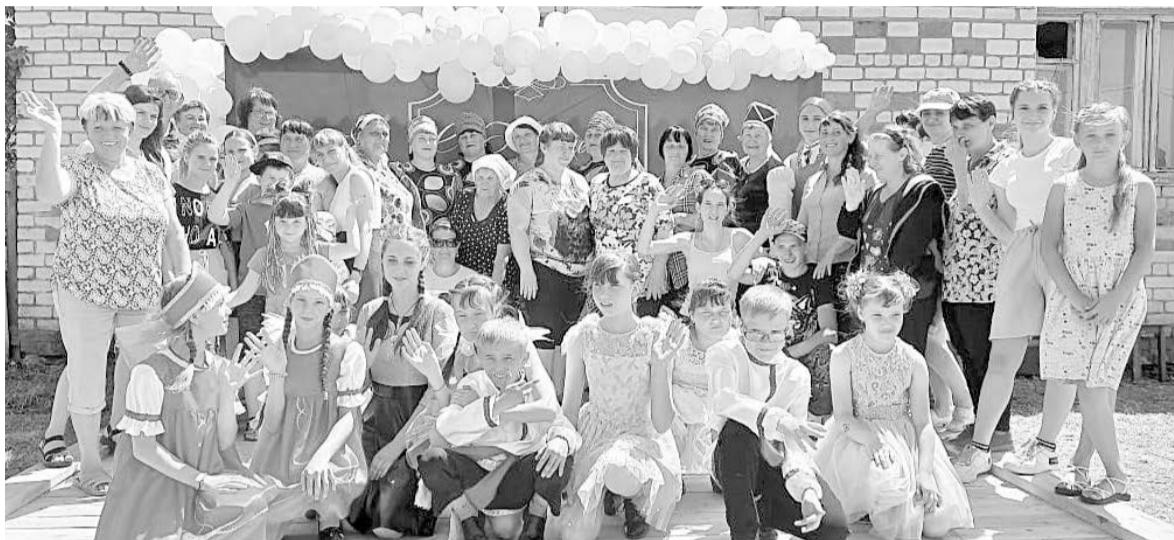
На празднике села