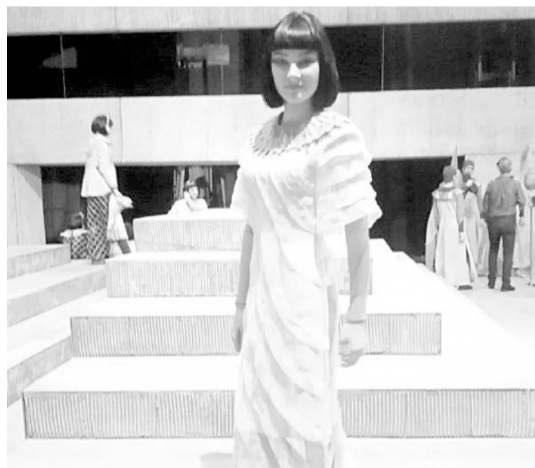
«Аида» Джузеппе Верди

проработать до трёх. Или, допустим, репетируем 5 часов, 2 часа перерыв и - концерт. В общем, по-разному.