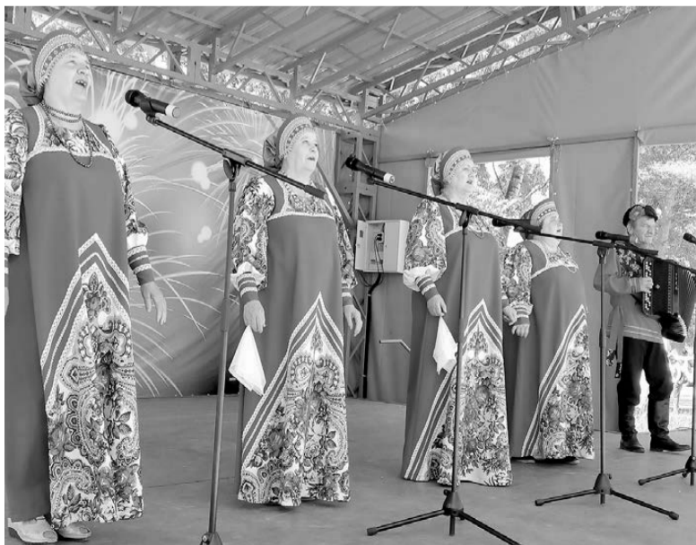
Гости из с. Ключи Константиновского района. Ромны. 12 июня 2022 года