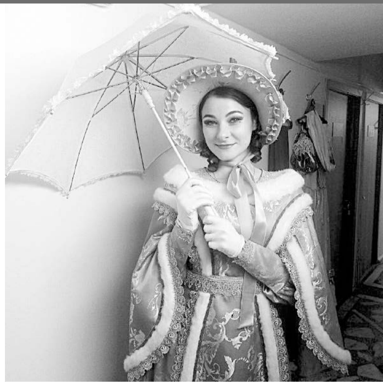
«Пиковая дама» П. И. Чайковский

- «Разрывной» график - с 11 час до 14 час и с 18 час до 21 час. Бывает, он ломается. Могут вызвать в 10 утра, и мы можем