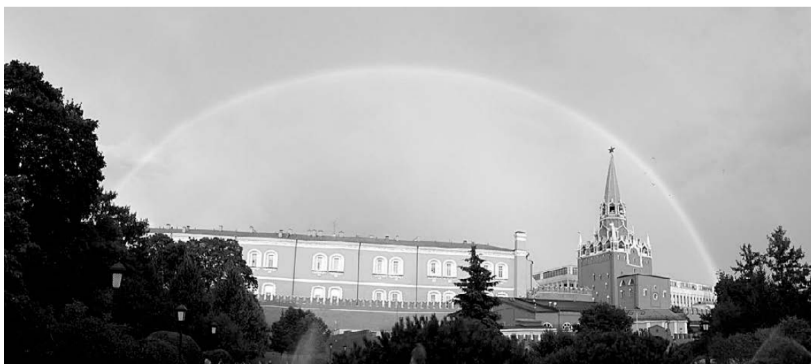
Радуга над Кремлём. 16 июля 2022 года