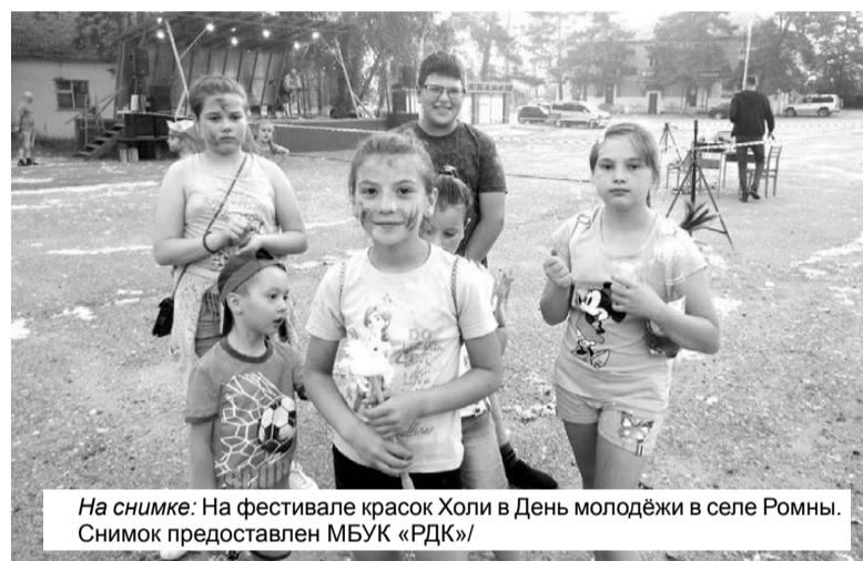
На снимке: На фестивале красок Холи в День молодёжи в селе Ромны.