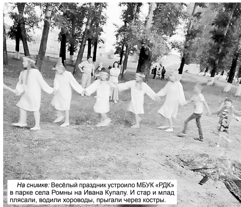
На снимке: Весёлый праздник устроило МБУК «РДК» в парке села Ромны на Ивана Купалу. И стар и млад плясали, водили хороводы, прыгали через костры.