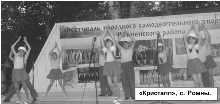
«Кристалл», с. Ромны.