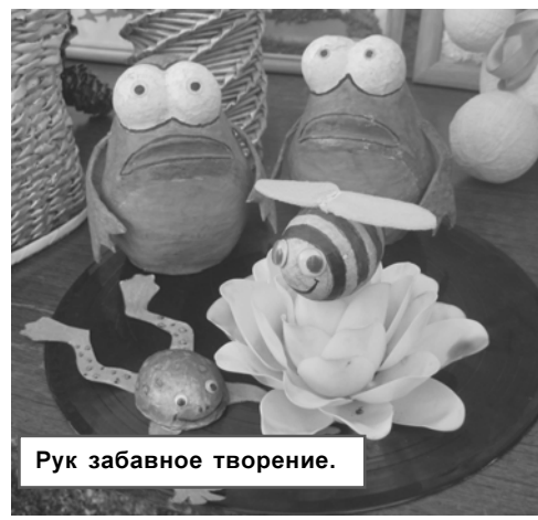
Рук забавное творение.