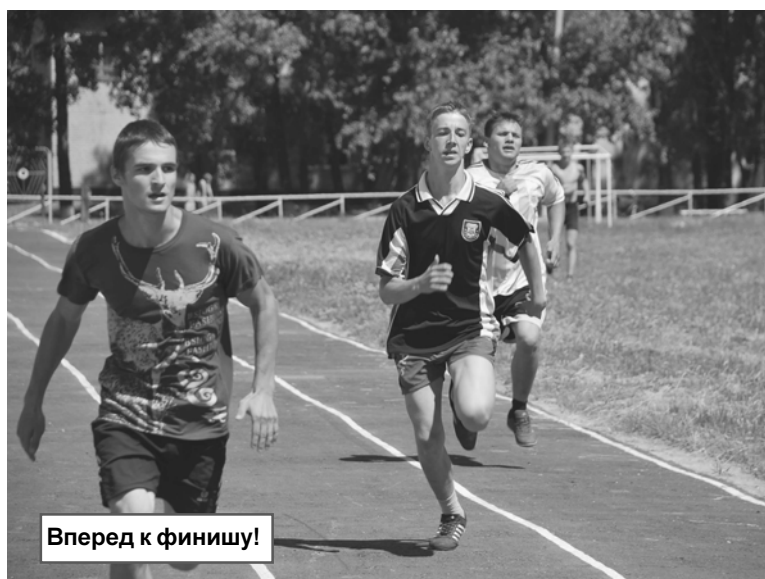
Вперед к финишу!