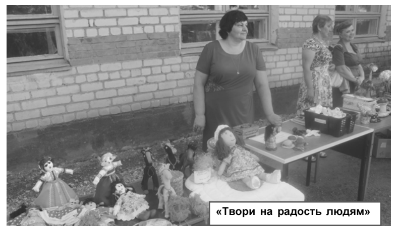
«Твори на радость людям»