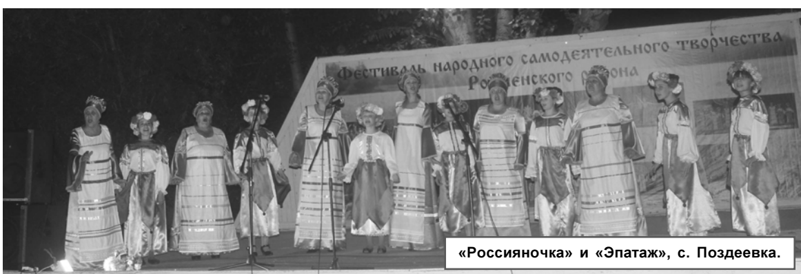
«Россианочка» и «Эпатаж», с. Поздеевка.