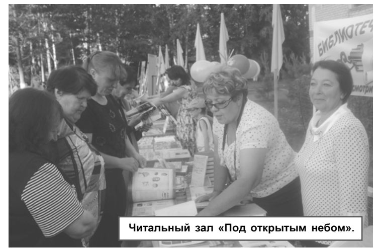
Читальный зал «Под открытым небом».