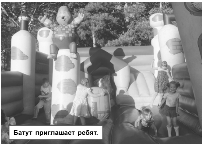
Батут приглашает ребят.