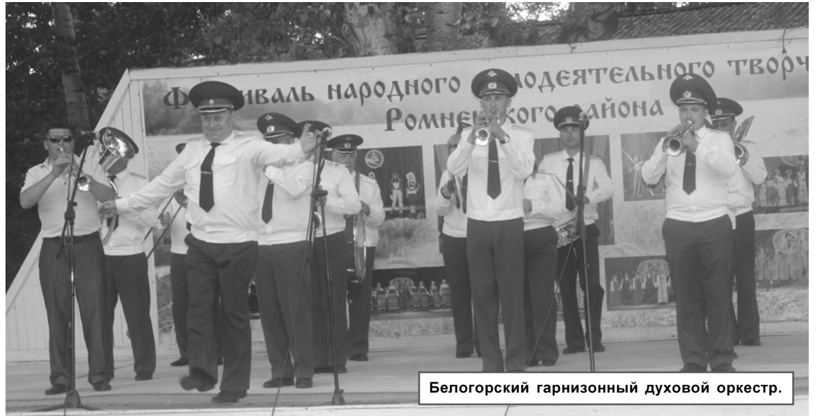
Белогорский гарнизонный духовой оркестр.