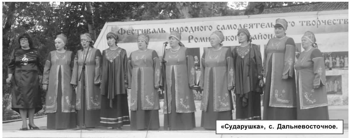
«Сударушка», с. Дальневосточное.