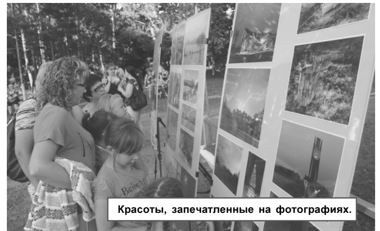
Красоты, запечатленные на фотографиях.