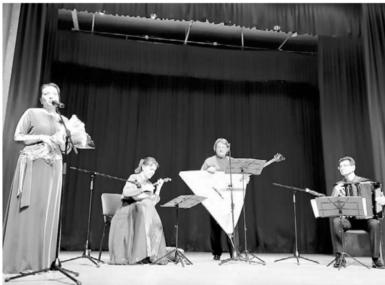
Концерт ансамбля народных инструментов «Карусель». ДК с. Ромны. 27 апреля 2022 г.