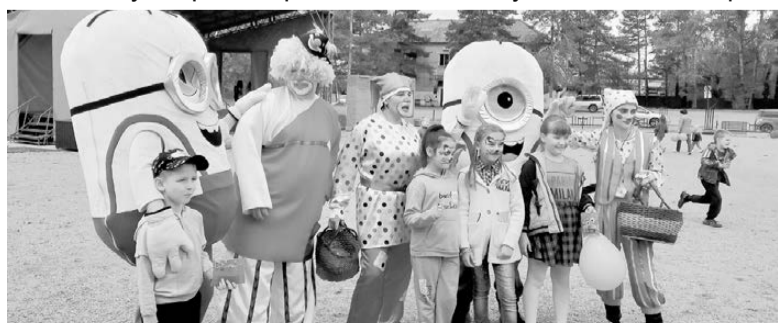
На площадке РДК. Ромны. 1 июня 2022 г.