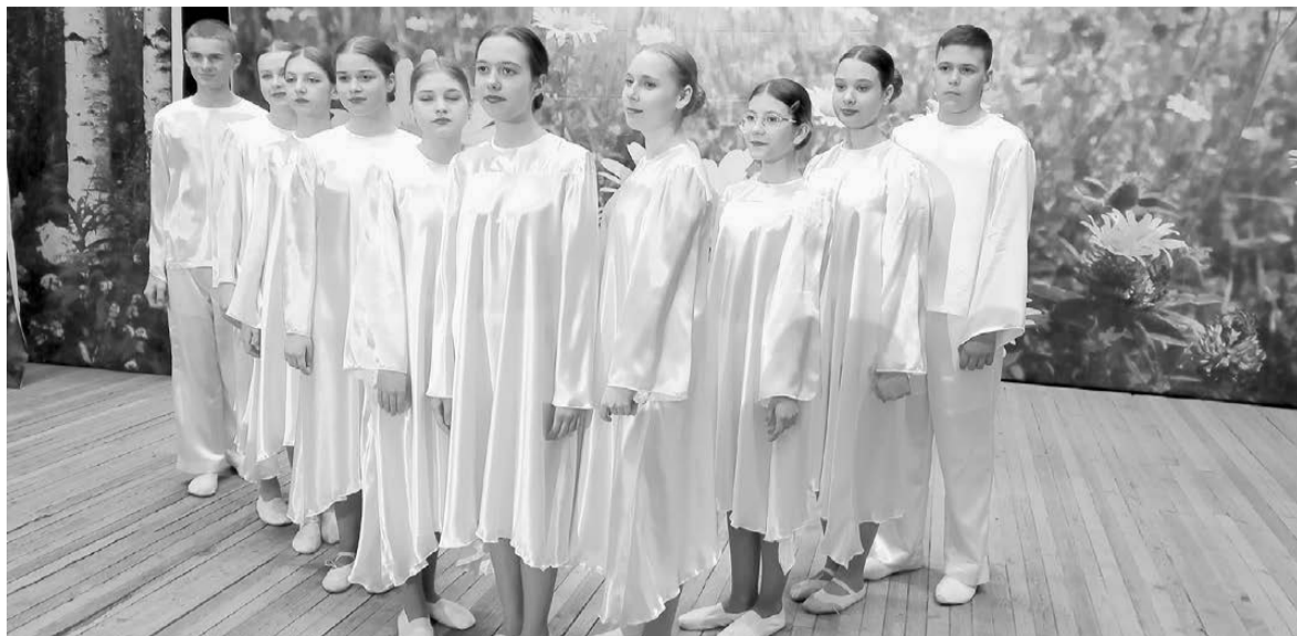
Творческие коллективы Ромненского ДК - на сцене ДК Константиновки. 15 мая 2022 г.