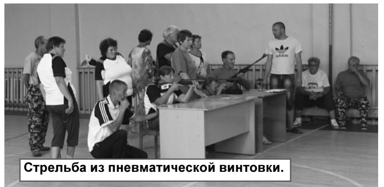
Стрельба из пневматической винтовки.