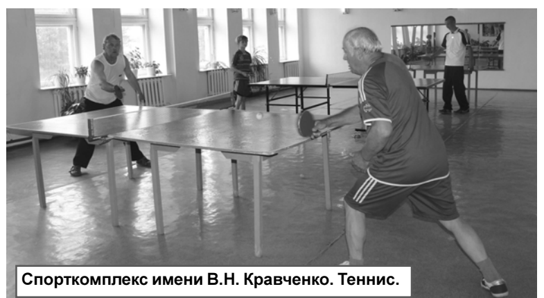
Спорткомплекс имени В.Н. Кравченко. Теннис.