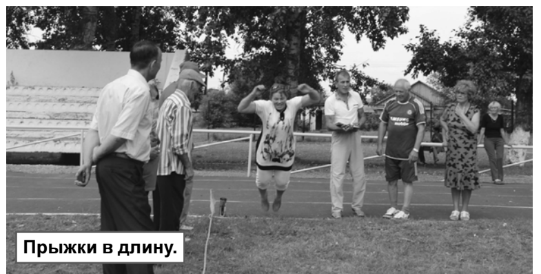
Прыжки в длину.