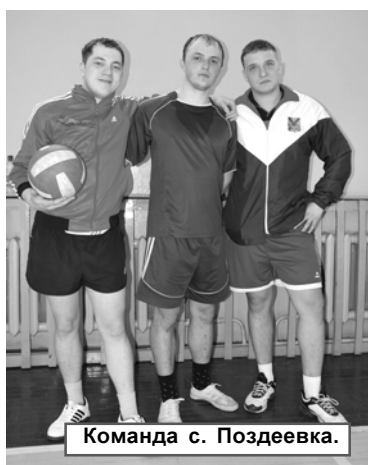
Команда с. Поддеевка.