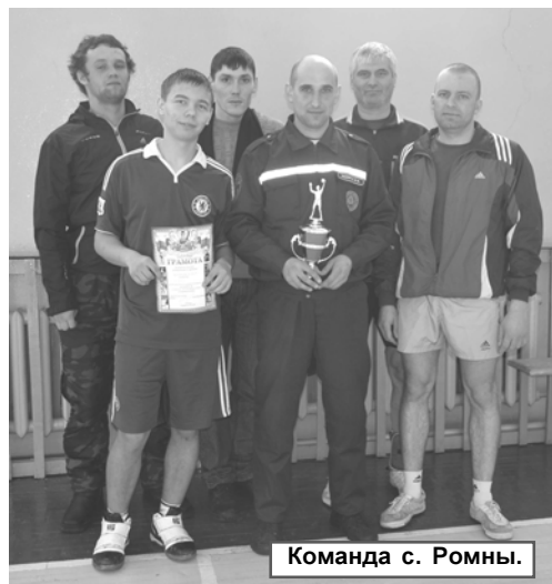
Команда с. Ромны.

Много усилий в завоевании победы приложили игроки села