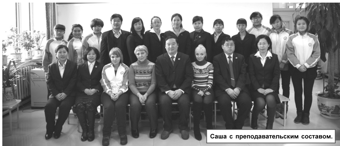
Саша с преподавательским составом.

«Поначалу вообще непонятно было, как можно освоить китайский, - делится Саша. - Количество иероглифов пугало. Очень сложно произносить все тона. Если неправильно один произнесешь, то значение слова будет другим. А со временем стало легче».