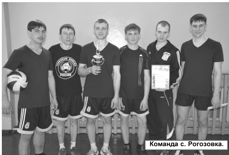
Команда с. Рогозовка.

09 февраля в спортзале ДЮСШ и Ромненской школе состоялись районные соревнования по волейболу.