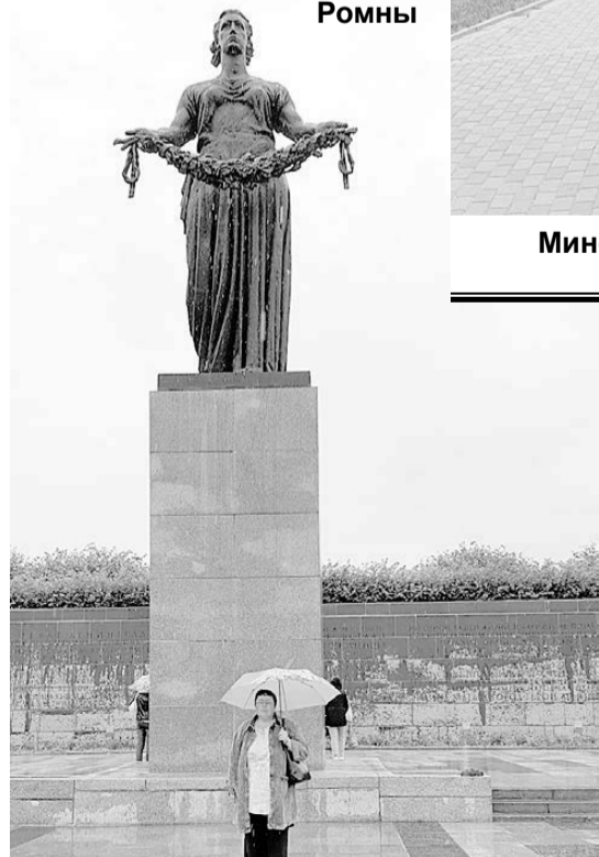
На Пискаревском кладбище