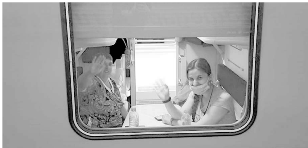
Прощай, Петербург! Мы обязательно вернёмся