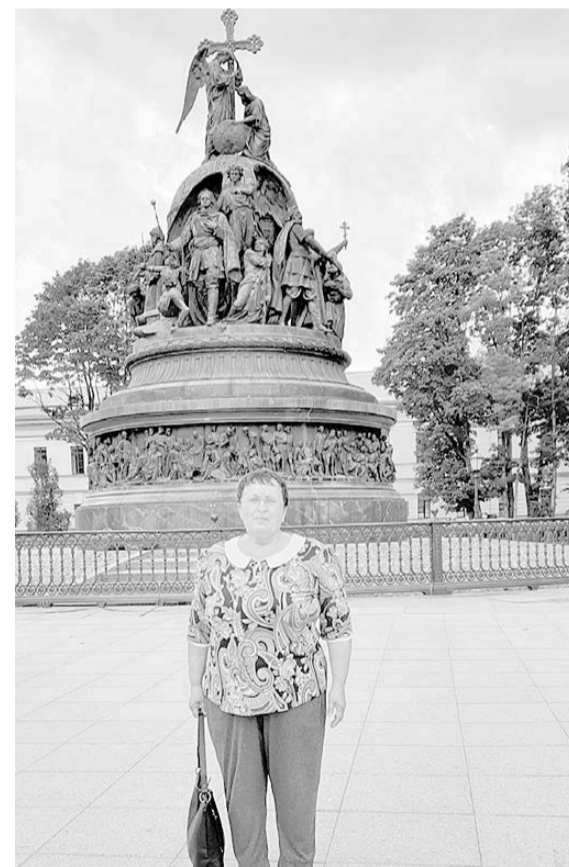
Великий Новгород. У памятника «Тысячелетие России»