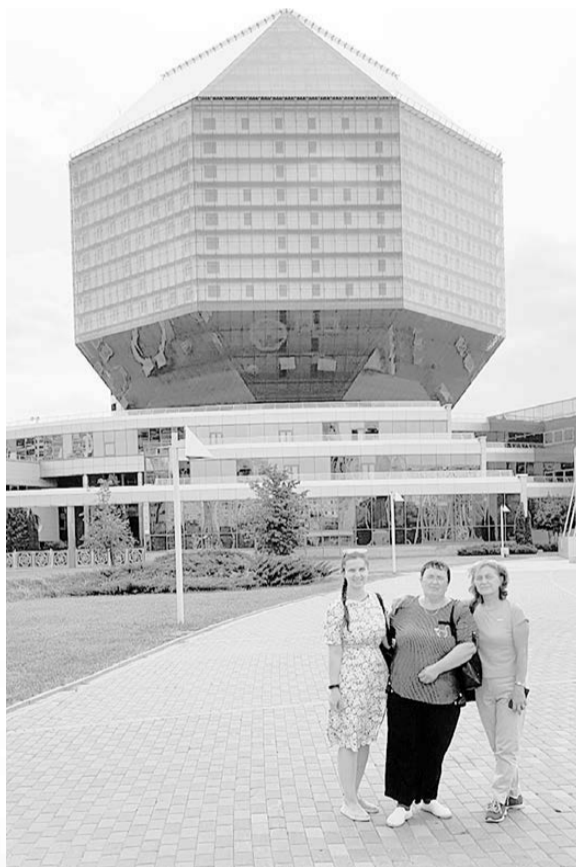
Минск. У здания Национальной библиотеки