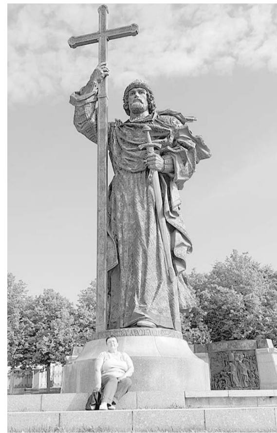
Москва. У памятника Владимиру Крестителю