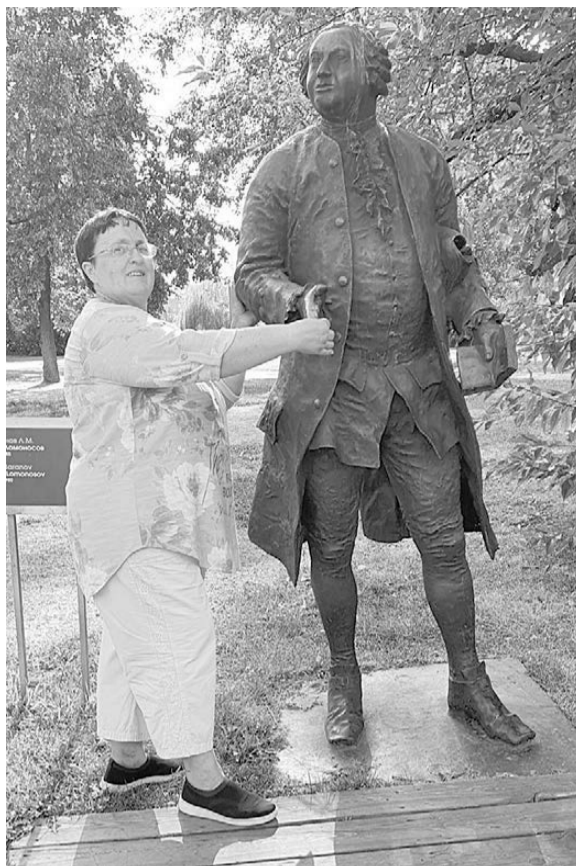
Москва. Как в Год науки не поздороваться с М. В. Ломоносовым!