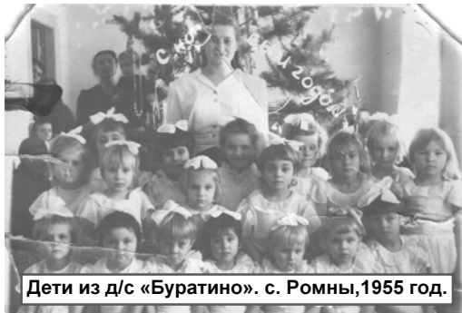
Дети из д/с «Буратино». с. Ромны, 1955 год.

- Шестидесятые годы прошлого века были не очень богатыми. Ставили елку и украшали ее игрушками больше ватными и бумажными, обязательно вешали стеклянные бусы, яблоки, мандарины и пряники в фольге. Мне доставался тульский пряник.