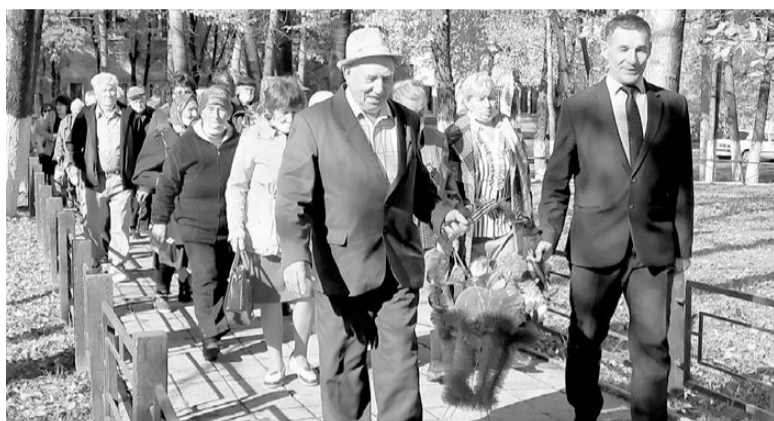
Возложение венков к памятнику воинам-землякам, погибшим в годы Великой Отечественной войны

Уважаемые учителя, ветераны педагогического труда и все работники сферы образования!