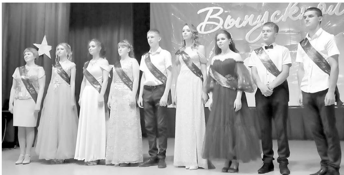
25 июня 2021 г. Ромненский ДК

Подписка-2021 на электронный вариант газеты «Знамя победы»