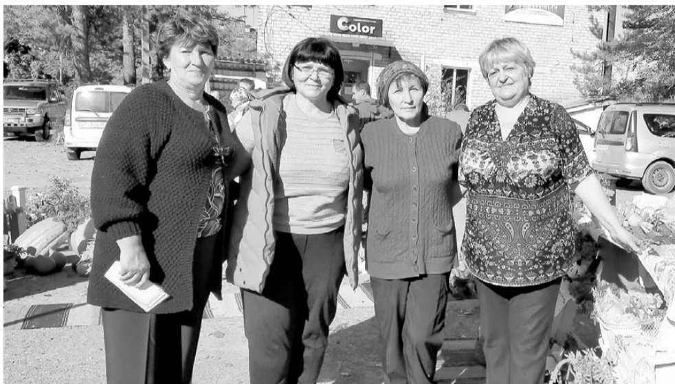
На сельскохозяйственной ярмарке. Ромны. 9 сентября 2022 года