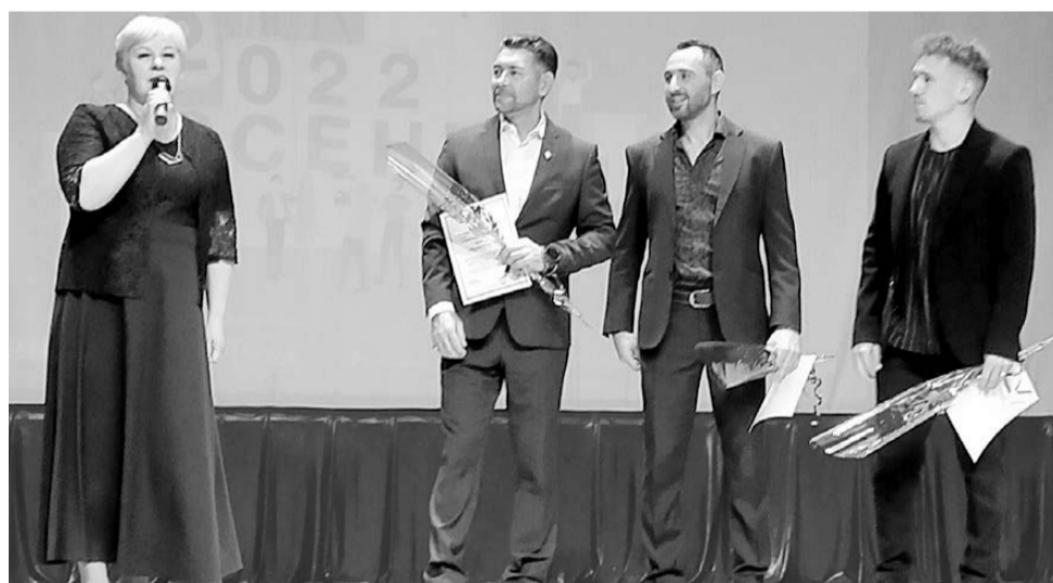
«Амурская осень» на сцене Дома культуры с. Ромны. 12 сентября 2022 года