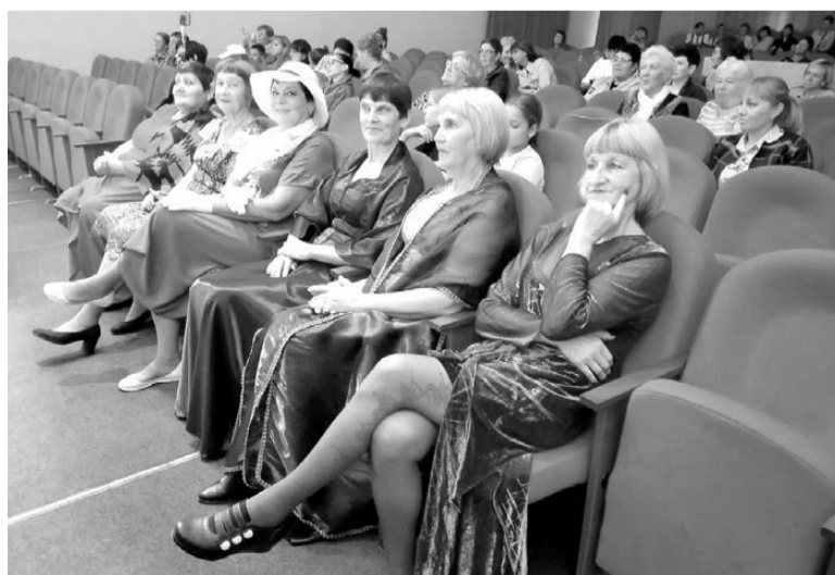
«Вкус жизни». В зрительном зале Дома культуры с. Ромны. 10 сентября 2022 года