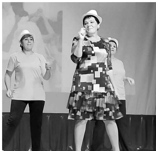
«Вкус жизни» на сцене Дома культуры с. Ромны. 10 сентября 2022 года