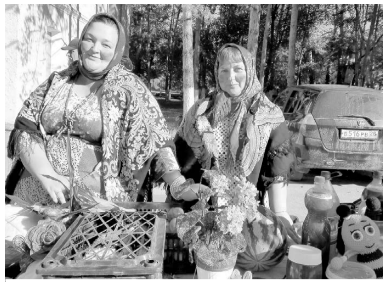
На сельскохозяйственной ярмарке. Ромны. 9 сентября 2022 года