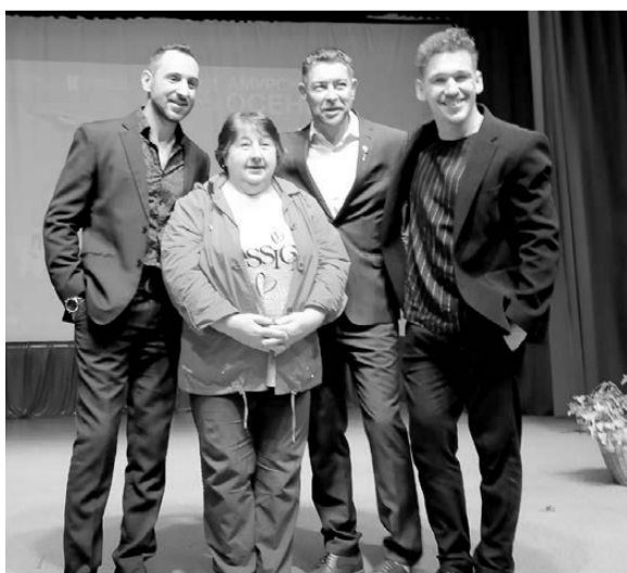
«Амурская осень» на сцене Дома культуры с. Ромны. 12 сентября 2022 года