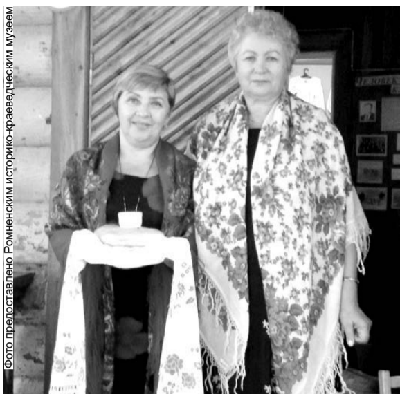
Гостей принимает Ромненский историко-краеведческий музей