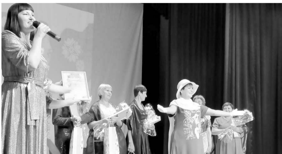
«Вкус жизни» на сцене Дома культуры с. Ромны. 10 сентября 2022 года