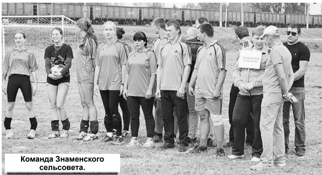
Команда Знаменского сельсовета.

Организаторы выражают огромную благодарность всем, кто принял участие в спортивном празднике, и тем, кто приехал поддержать участников!!!