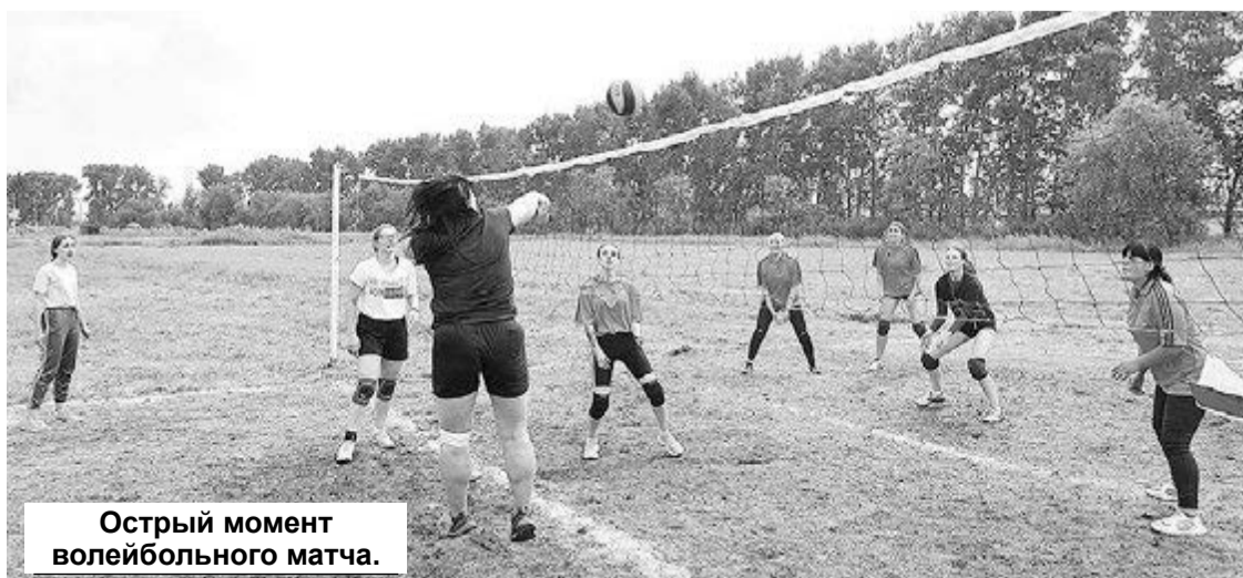
Острый момент волейбольного матча.