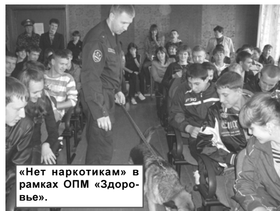
«Нет наркотикам» в рамках ОПМ «Здоровье».