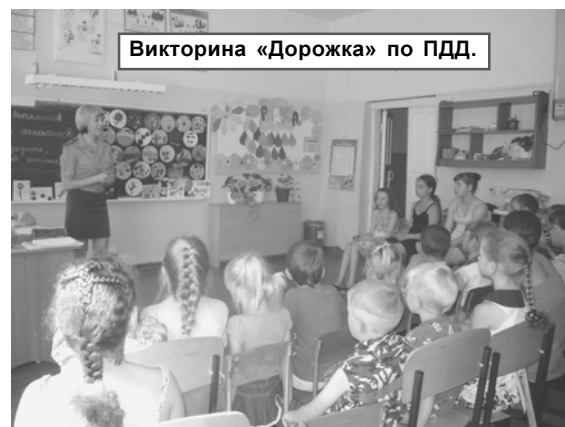
Викторина «Дорожка» по ПДД.

блеск в детских глазах за подаренную плюшевую зверушку.