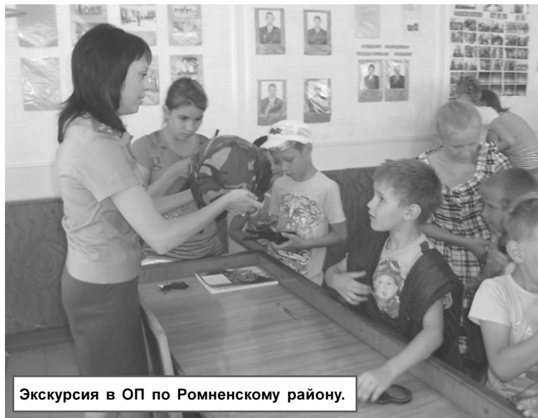
Экскурсия в ОП по Ромненскому району.