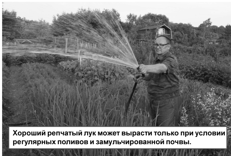
Хороший репчатый лук может вырасти только при условии регулярных поливов и замульчированной почвы.

Если вы до сих пор не окучили растения томатов, проведите данную операцию. Окучивание способствует образованию дополнительных корней и как следствие, увеличению урожая плодов. Улучшается отток излишней влаги из посадок.