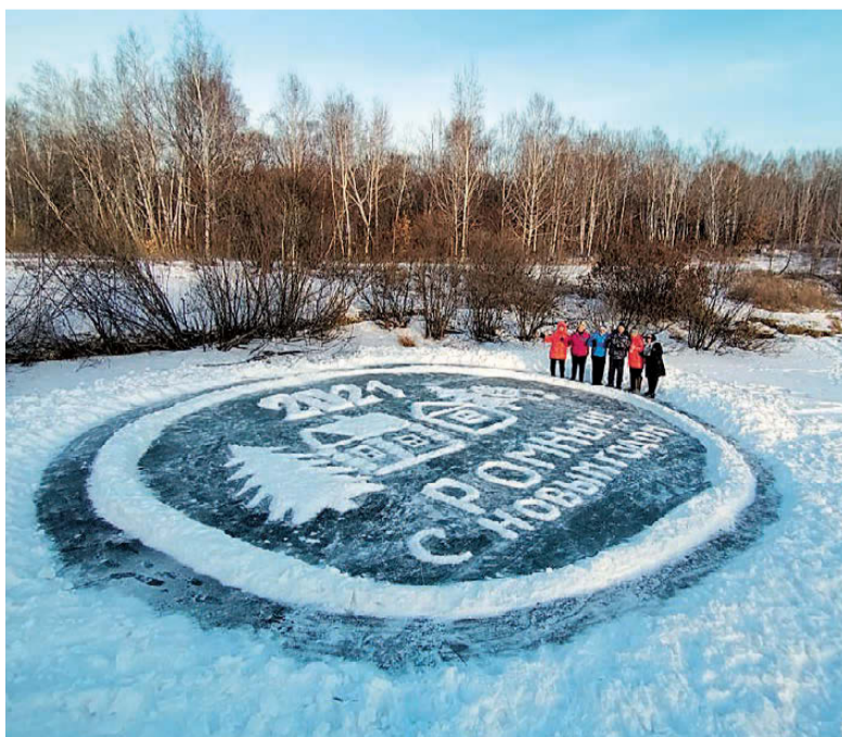
Поздравление ромненцам на льду в районе дамбы на конкурс «Амурской правды» подготовил «Позитив» МБУК «РДК» с. Ромны

В сентябре 2020 года я в составе группы из 13 пенсионеров Амурской области посетила Санкт-Петербург. Такое путешествие стало возможным благодаря субсидированию Правительством страны авиаперелетов гражданам Российской Федерации пенсионного возраста, то есть льготным авиабилетам. Дорога до Питера и обратно обходится примерно в 13-15 тыс. руб., что и было использовано туристической фирмой.