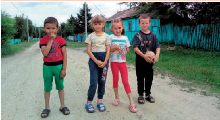
Вместе весело шагать. Дальневосточное