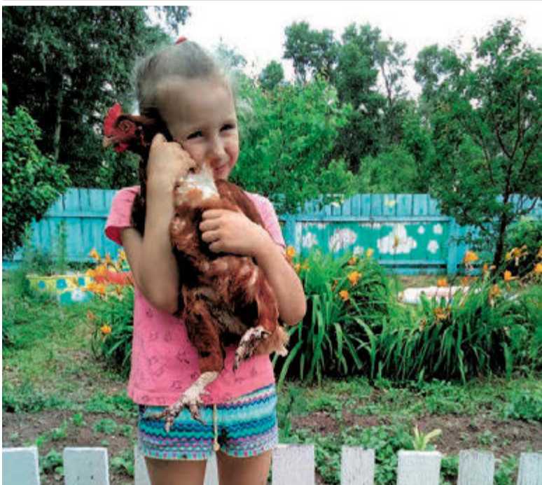
От меня не убежишь. Дальневосточное