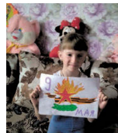
Интернет-конкурс «Дедушкина медаль». Чергали