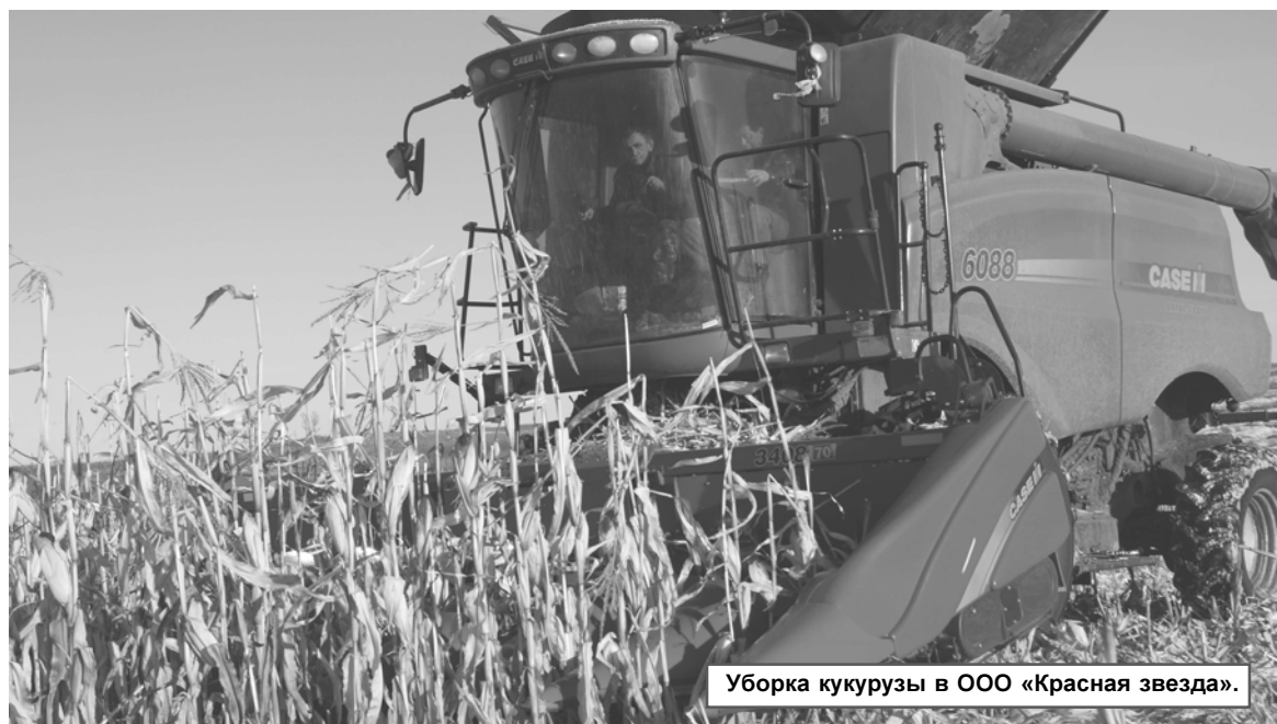
Уборка кукурузы в ООО «Красная звезда».