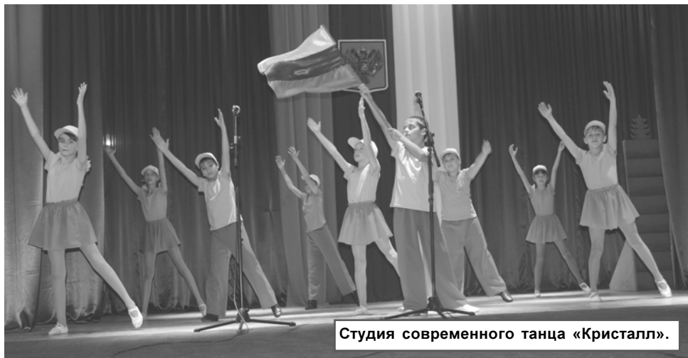
Студия современного танца «Кристалл».

4 ноября в РДК прошел районный конкурс чтецов с символическим названием «Судьба и Родина едины». Зрители и участники мероприятия не только читали наизусть и слушали стихи и прозу, а также наслаждались музыкальными номерами, пропитанными соответствующей праздничной «российской» тематикой, ведь повод для встречи оказался двойным, будучи приуроченным к торжественной дате. Ратный подвиг народных ополченцев, освободивших столицу нашей Родины от польско-литовских захватчиков, лег в основу истории Дня народного единства. Много в календаре есть красных дней, но этот особый, ведь он как никогда подразумевает славный народный патриотизм.