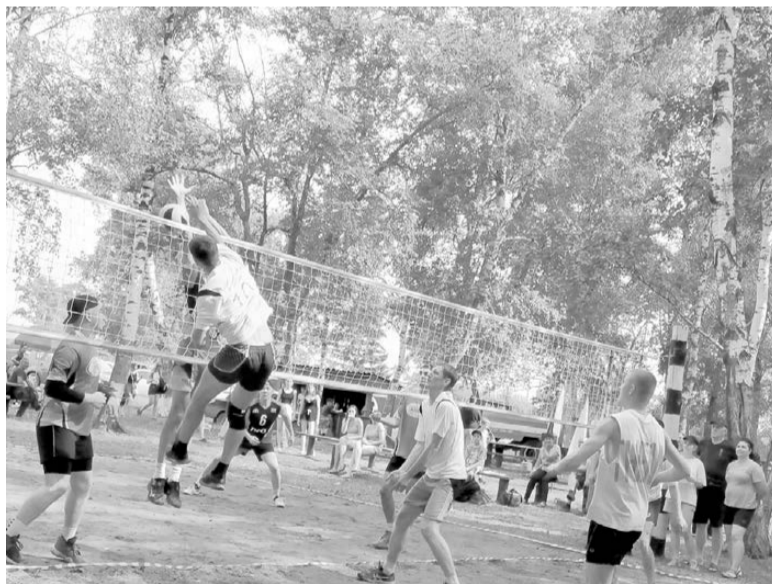
На волейбольной площадке