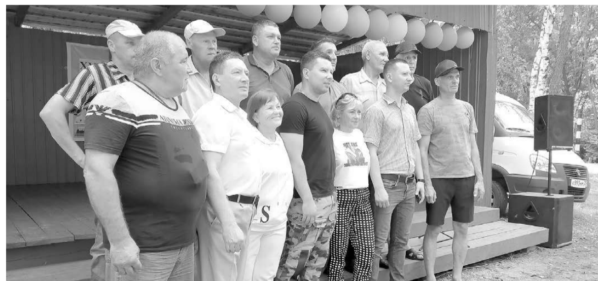
Встреча с ветеранами правоохранительных органов